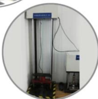
Impact Resistant Testing Machine