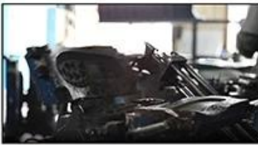
4. Open The Mould