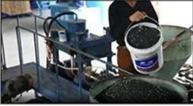
1. Mixing Materials