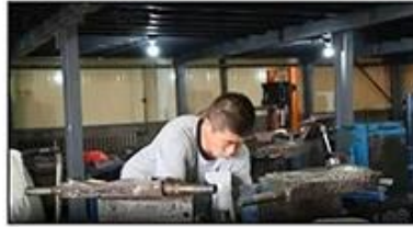
2. Putting Polyester Lining