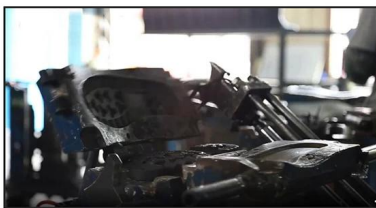
4. Open The Mould