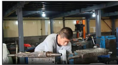
2. Putting Polyester Lining