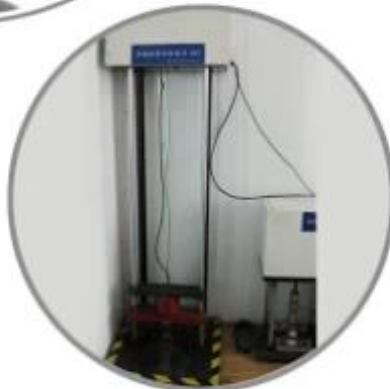
Impact Resistant Testing Machine