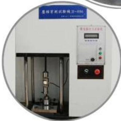
Puncture Testing Machine