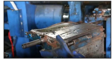
3. PVC Injection