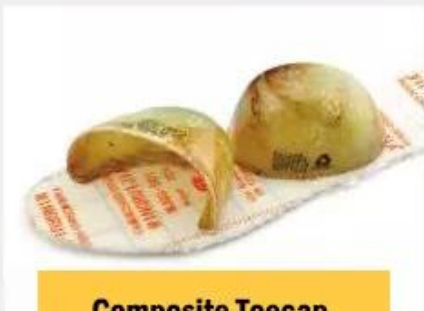
Composite Toe cap