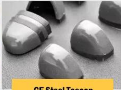
CE Steel Toe cap