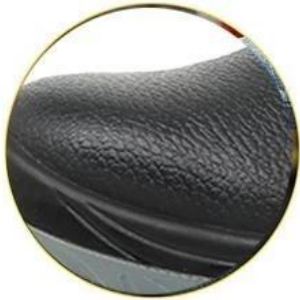
Waterproof leather upper

Removable metatomical EVA footbed provides long-lasting underfoot support and comfort.