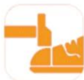
200 JOULE TOECAP