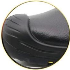
Waterproof cow leather upper

Removable metatomical HI-POLY footbed provides long-lasting underfoot support and comfort.