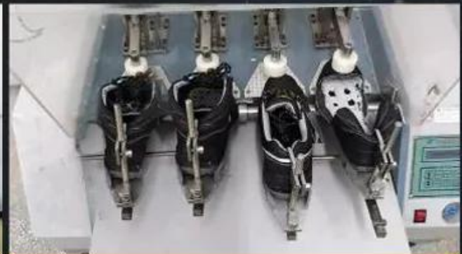
Flex Tester \geq 36,000 T