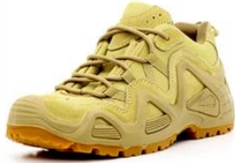
Safety Work Shoes