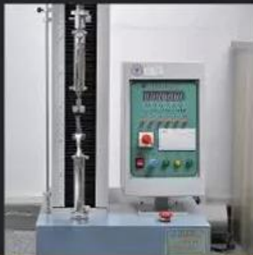
Tear Strength \geq 120 N