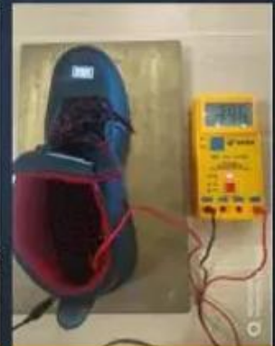
ESD Anti-Static Test