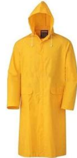
Rain Coat/ Suit