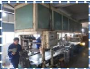
Heat - Setting