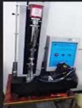
Bondness Test \geq 4.0 N/mm