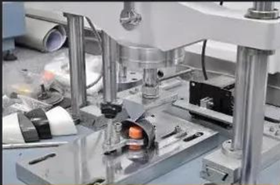
Toecap Test \geq 200 Joules