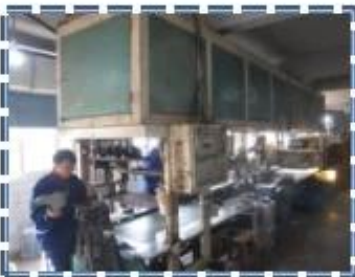
Heat - Setting